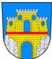
Město Teplice nad Metují