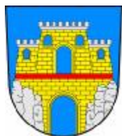
Město Teplice nad Metují