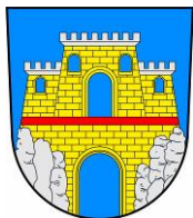
Město Teplice nad Metují